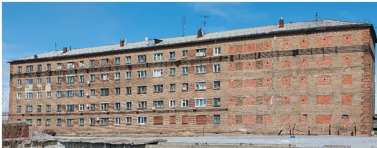
Рис. 1. Усиленное металлическими тязами здание с частичным отселением жителей (Воркута, Локомотивная ул., д. 5а) Fig. 1. Building reinforced by metal ties with partial resettlement of residents (Vorkuta, Lokomotivnaya St., 5a)

характеризующийся распространением с поверхности преимущественно талых грунтов аллювиального генезиса песчаного состава. Острова многолетнемерзлых грунтов были развиты фрагментарно и имели незначительную мощность. Жилые здания, преимущественно пятиэтажные, строились как на свайных, так и на ленточных фундаментах с теплыми подвалами. Опыт первых 20 лет эксплуатации жилого фонда продемонстрировал, что такая практика зарекомендовала себя положительно, в том числе на участках распространения маломощных линз ММГ. При оттаивании линз мерзлых слабльдистых песков в основаниях зданий они испытывали незначительные деформации, но в целом сохраняли работоспособное состояние.