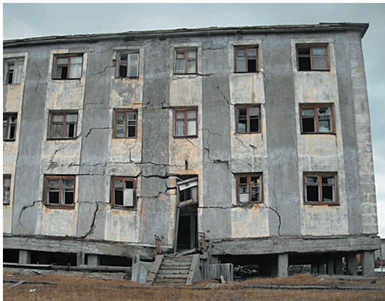
Рис. 3. Разрушенное здание в поселке Амдерма на арктическом побережье Fig. 3. Destroyed building in Amderma on the Arctic coast

Сохранность сооружений может быть обеспечена проведением геотехнического мониторинга. В Новом Уренгое и Надыме в ряде случаев здания и сооружения имели избыточное тепловыделение в основании, ведущее к деградации мерзлых грунтов и линз мерзлоты, сопровождающейся осадками. Тем не менее все было благополучно, пока в сфере взаимодействия с сооружениями находились