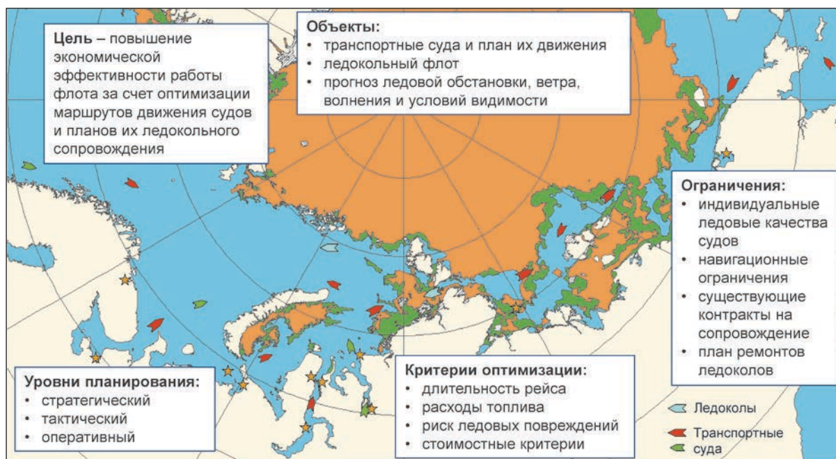
Рис. 1. Общая схема задачи планирования работы судов и ледоколов в Арктике Fig. 1. General description of the task of planning ships and icebreakers operation in the Arctic

лучить существенный экономический эффект. Помимо этого отдельными важными задачами являются снижение повреждаемости корпусов и движителей во льдах, а также повышение надежности работы арктической транспортной линии в целом.