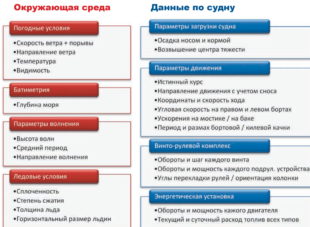
Рис. 3. Ориентировочный перечень параметров, которые следует измерять бортовым регистратором данных рейса во льдах Fig. 3. Preliminary list of parameters to be measured by the onboard data recorder of ship voyage in ice

этом приходится дополнительно учитывать, что на некоторых участках судно может двигаться самостоятельно, а на других — под проводкой ледокола. Однако поиск оптимального маршрута движения судна с ледоколом или без него — это лишь наиболее понятная составляющая общей проблемы тактического планирования. Последняя заключается в формировании расписания рейсов судов и ледоколов, а также в планировании состава караванов, дат и мест их сбора и роспуска. С математической точки зрения эта проблема может быть отнесена к классу сложных комбинаторных NP-полных задач, для которых доказано принципиальное отсутствие эффективного универсального алгоритма, позволяющего найти строго оптимальное решение за разумное время. Более того, при планировании арктического судоходства приходится сталкиваться с дополнительными усложняющими факторами. Во-первых, это необходимость искать решение в условиях сильной неопределенности ледовой обстановки, которая в масштабах периода навигации может быть спрогнозирована лишь самым приблизительным образом, например на основе года-аналога. Во-вторых, в отличие от задач логистического планирования автомобильных или железнодорожных перевозок, где дороги представляют собой естественные ребра графа оптимизации, морские перевозки осуществляются в непрерывном пространстве (например, местом сбора каравана может быть назначена про-