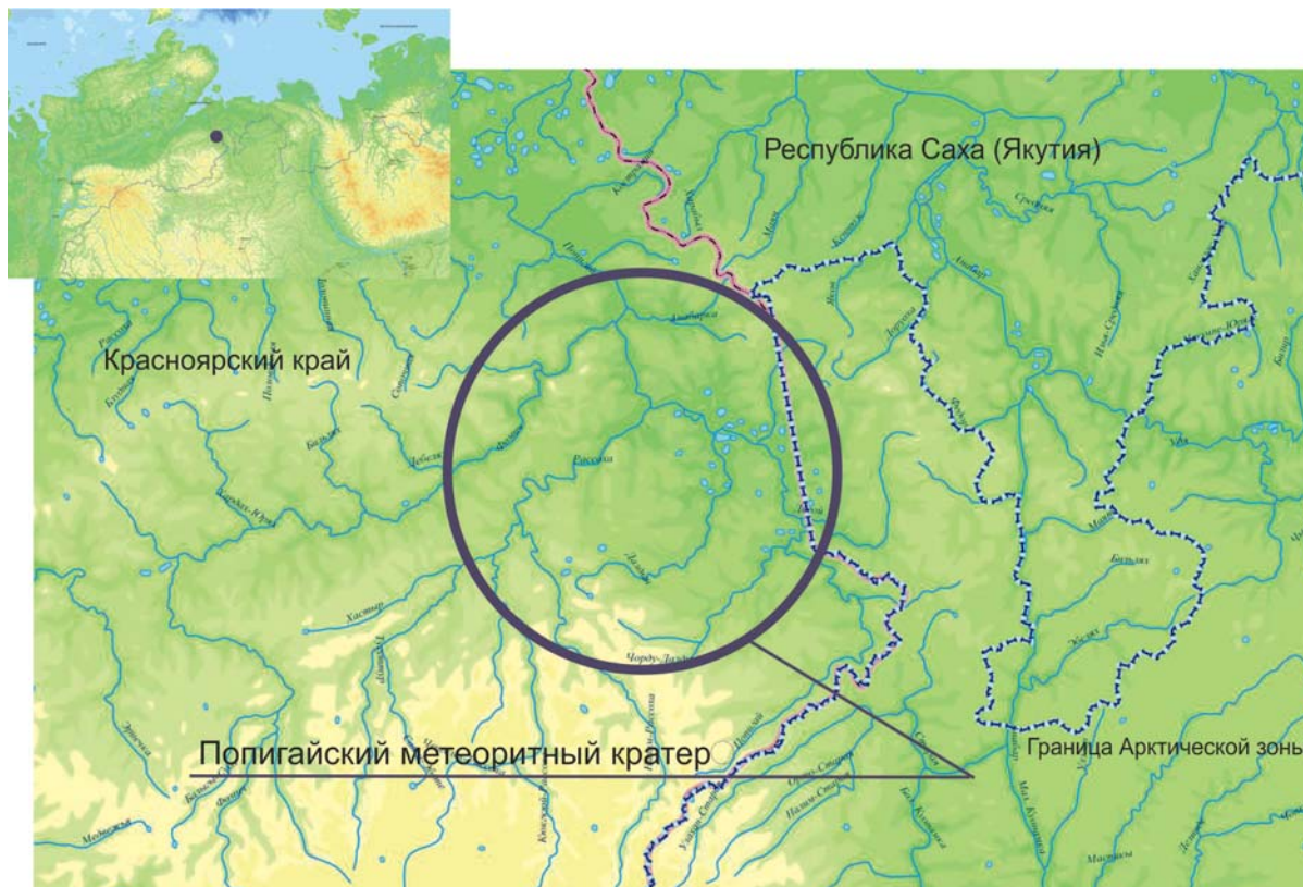
Рис. 1. Место расположения Полигайского метеоритного кратера

промышленных сферах: нефтегазодобыче и горной добыче, металлообработке и материалобработке, оптико-механической промышленности, строительстве и других направлениях. Производство высокотехнологичной продукции позволяет создать дополнительный экспортный потенциал как наукоемкого сектора российской экономики, так и нового сырьевого материала, который может быть интегрирован в зарубежные технологические цепочки.