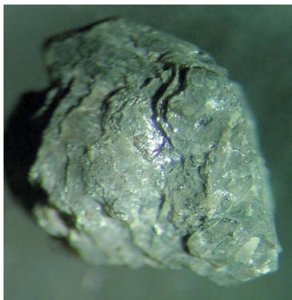
Рис. 3. Крупный импактный алмаз (размер около 1 см)

В частности, до недавнего времени не уделялось должного внимания природному алмазному сырью, поскольку этот материал был слишком дорог. Но теперь в Европе и Японии ведутся разработки алмазных чипов, которые совершат революцию как минимум в полупроводниковой промышленности. Кроме того, производители искусственных алмазов предполагают, что покорение ювелирного рынка им необходимо и для того, чтобы обеспечить инвестиции в исследования в области технологического применения алмазов. Именно этот рыночный сегмент сейчас более прибылен, и поле для деятельности на нем значительно шире.