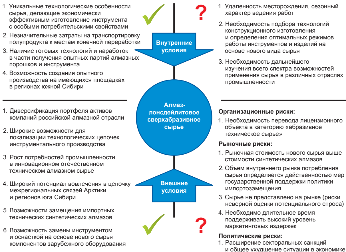
Рис. 5. Анализ возможностей и угроз реализации проекта производства алмаз-лонсдейлитового абразивного материала на основе сырья Попигайского месторождения