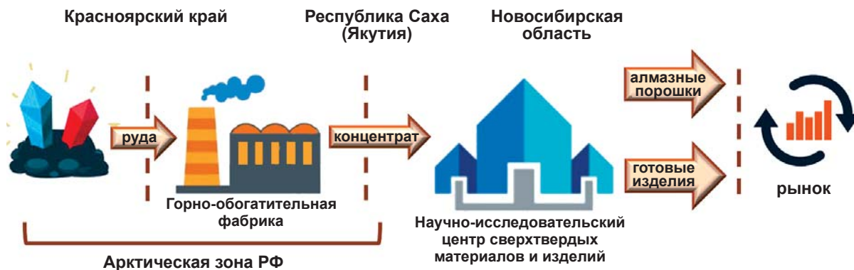
Рис. 4. Технологическая цепочка реализации Попигайского проекта