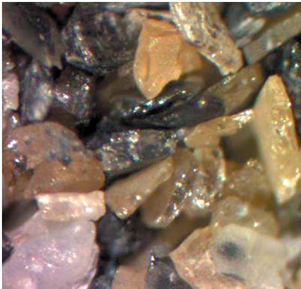
Рис. 2. Частицы импактных алмазов (размер 100–200 мкм)

с использованием высокоэффективного алмазного абразивного сырья; • вовлечь в оборот потенциал отечественной минерально-сырьевой базы технического алмазного сырья [4].