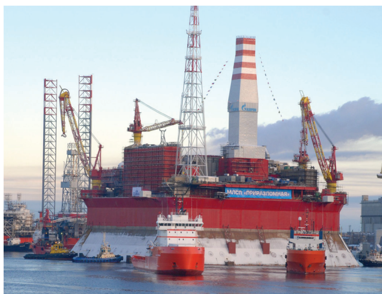
Рис. 1 Морская платформа «Приразломная»

В то же время готовность к решению таких масштабных задач на уровне государственных органов, нефтегазовых и транспортных компаний пока недостаточна. Сложнейшие условия Арктики и удаленность инфраструктуры требуют решения многих технико-технологических, экологиче-