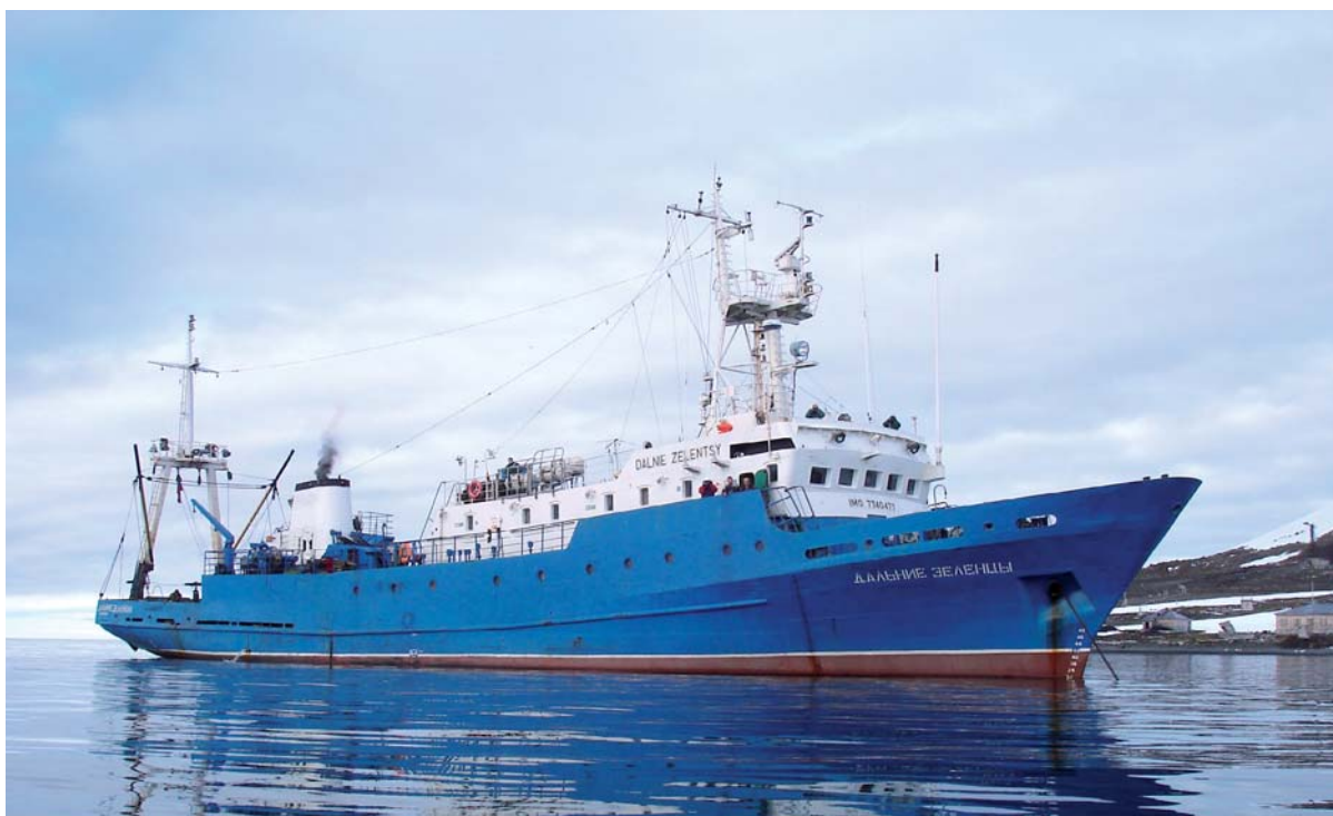
Рис. 2. Судно Мурманского морского биологического института «Дальние Зелёные»

при разработке новых месторождений. Освоение региона потребует огромных капитальных вложений, однако это совершенно оправданно, если учесть уникальный объем запасов и все растущий спрос на углеводороды в мире на долгосрочную перспективу.