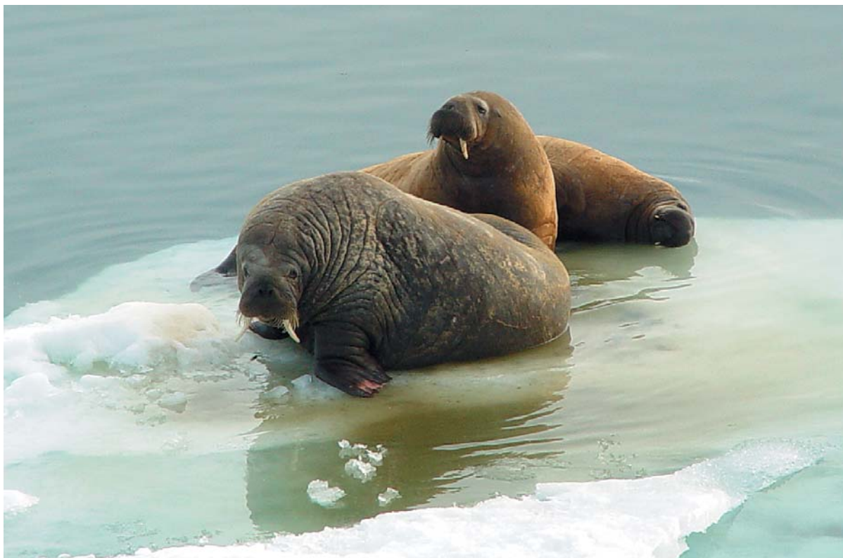
Рис. 3а. Уязвимые виды морских млекопитающих: морж атлантический Odobenus rosmarus rosmarus . Фотография сделана в экспедициях ММБИ на атомных ледоколах

шой вклад по сравнению с их аналогами в европейских морях. Правда, в холодных арктических морях загрязнения более устойчивы и, что особенно важно, могут накапливаться в тканях морских рыб и млекопитающих, составляющих основу питания местных жителей. Исследования этих процессов уже длительное время занимают важное место в международных программах по экологии Арктики [13, 14].